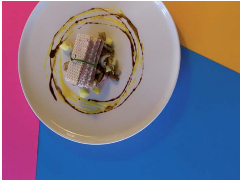
WAFER CON TONNO, TARTUFO, FUNGHI, ANANAS, SPUMA ACIDA